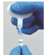
バイアルキャップ ▲ 取外しツール

1 回分 (1 プレート分) ずつ、アルミパウチに入っています。(1 箱 12 袋入)