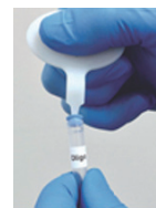
バイアルキャップ ▲ 取外しツール

1 回分 (1 プレート分) ずつ、アルミパウチに入っています。(1 箱 6 袋入)