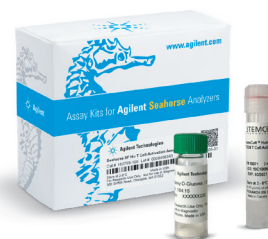
Seahorse XF Hu T Cell Activation Assay Profile

本キットでは、可溶性の ImmunoCult Human CD3/CD28 T Cell Activator (STEMCELL Technologies) と2-デオキシ-D-グルコースを組み合わせた標準アッセイにより、異なるドナーまたは介入 (例えば遺伝子および/または薬剤の介入) の適用を受けたT細胞間で、T細胞活性化の潜在能力を比較することができます。アクチベーター注入の前に試験化合物の注入を追加したモジュレーションアッセイでは、T細胞活性化の潜在能力に対する試験化合物の急性の影響を調べることができます。