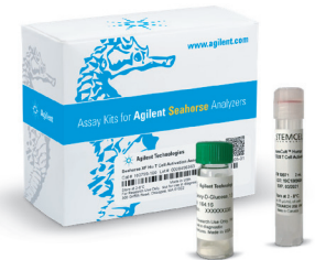
Seahorse XF Hu T Cell Activation Assay Profile

本キットでは、可溶性の ImmunoCult Human CD3/CD28 T Cell Activator (STEMCELL Technologies) と2-デオキシ-D-グルコースを組み合わせた標準アッセイにより、異なるドナーまたは介入 (例えば遺伝子および/または薬剤の介入) の適用を受けたT細胞間で、T細胞活性化の潜在能力を比較することができます。アクチベーター注入の前に試験化合物の注入を追加したモジュレーションアッセイでは、T細胞活性化の潜在能力に対する試験化合物の急性の影響を調べることができます。